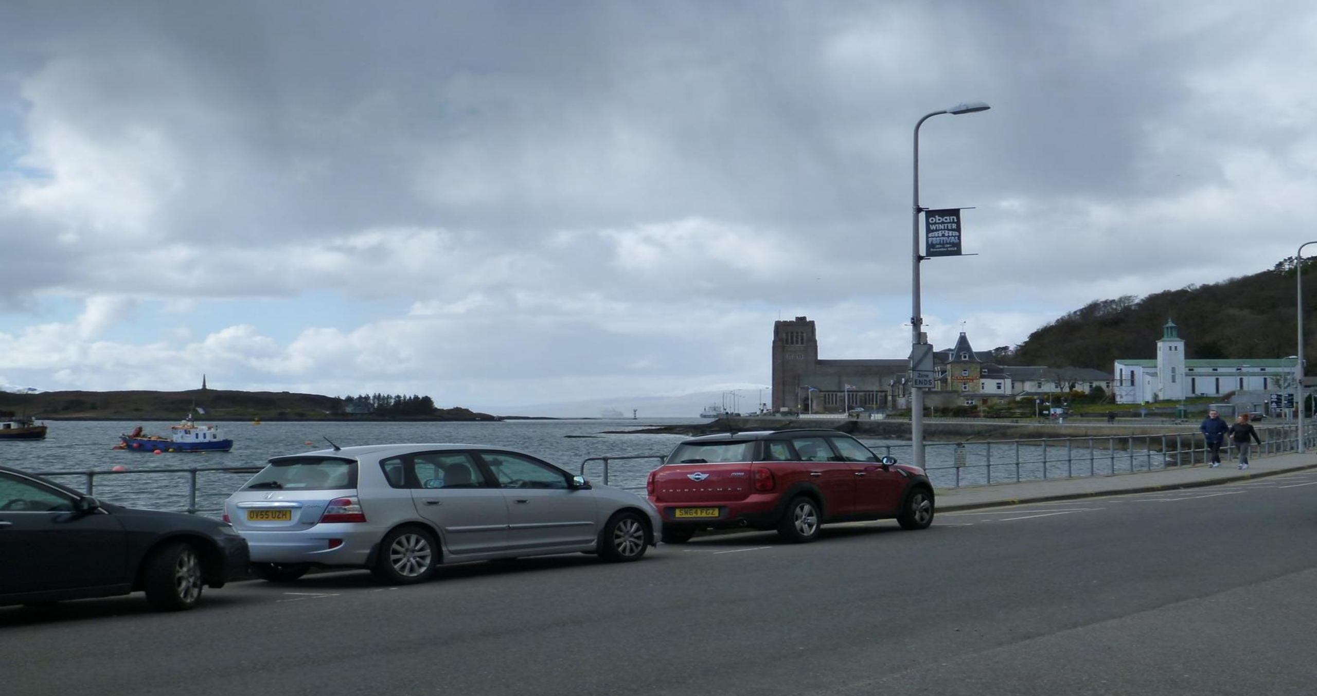
...machten wir einen Abstecher an die Küstenstadt Oban!