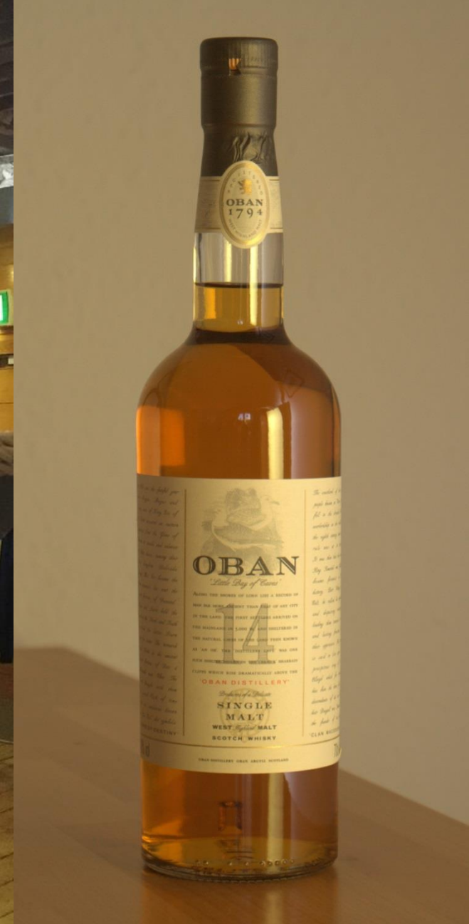
Nach Besichtigung der Destillery wurde sich erstmal mit Stoff eingedeckt.