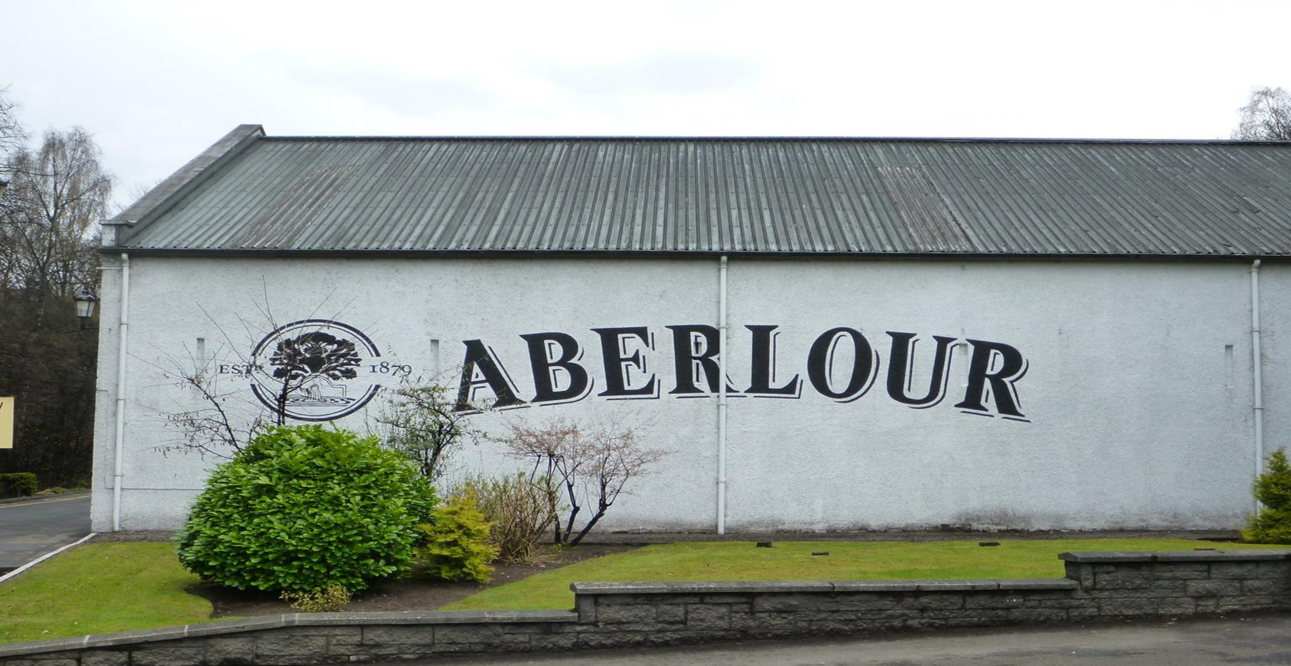
Und in Aberlour. Hier füllte Klaus alle Freimengen an Whisky in seinen Rucksack