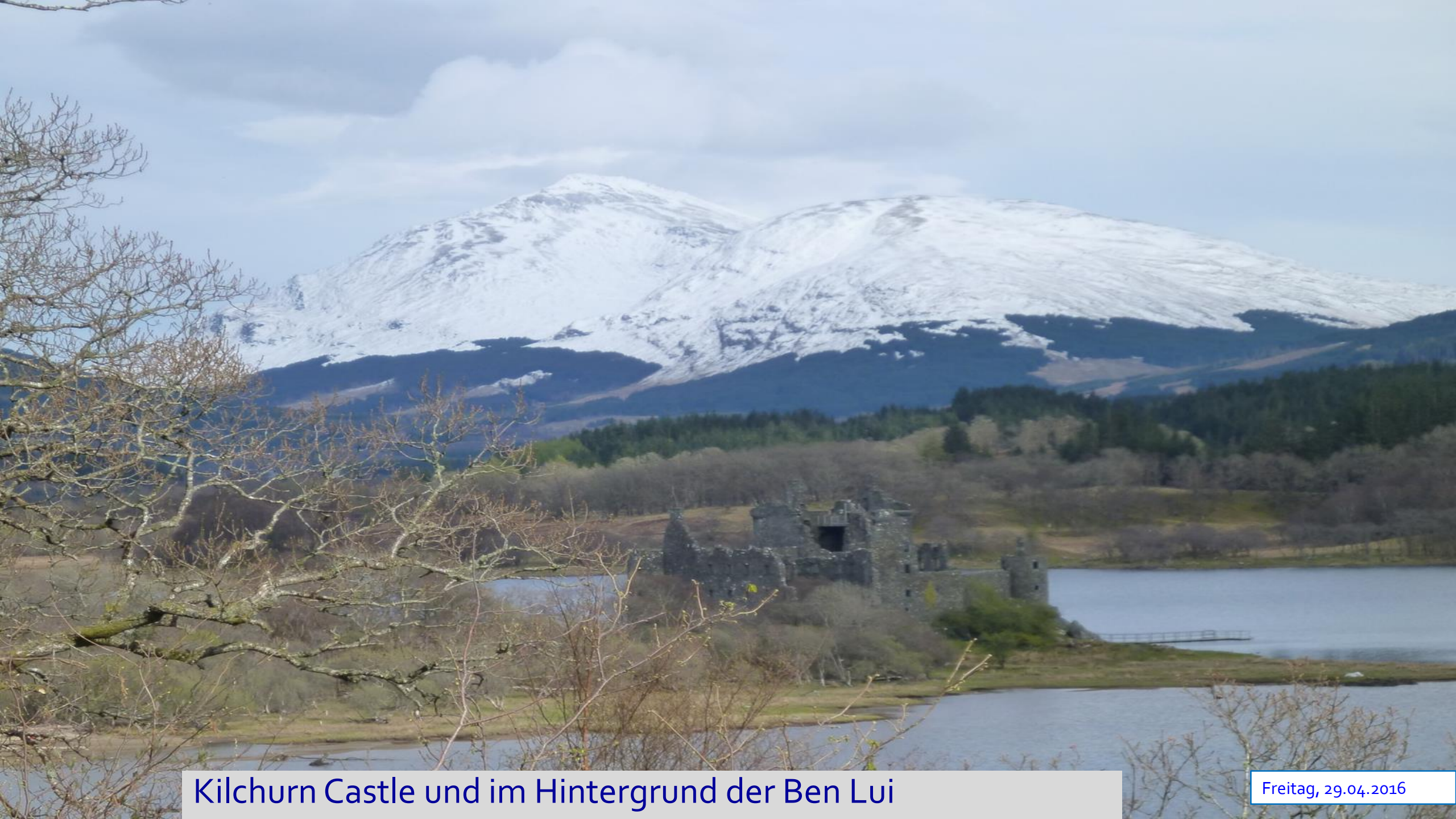
Kilchurn Castle und im Hintergrund der Ben Lui