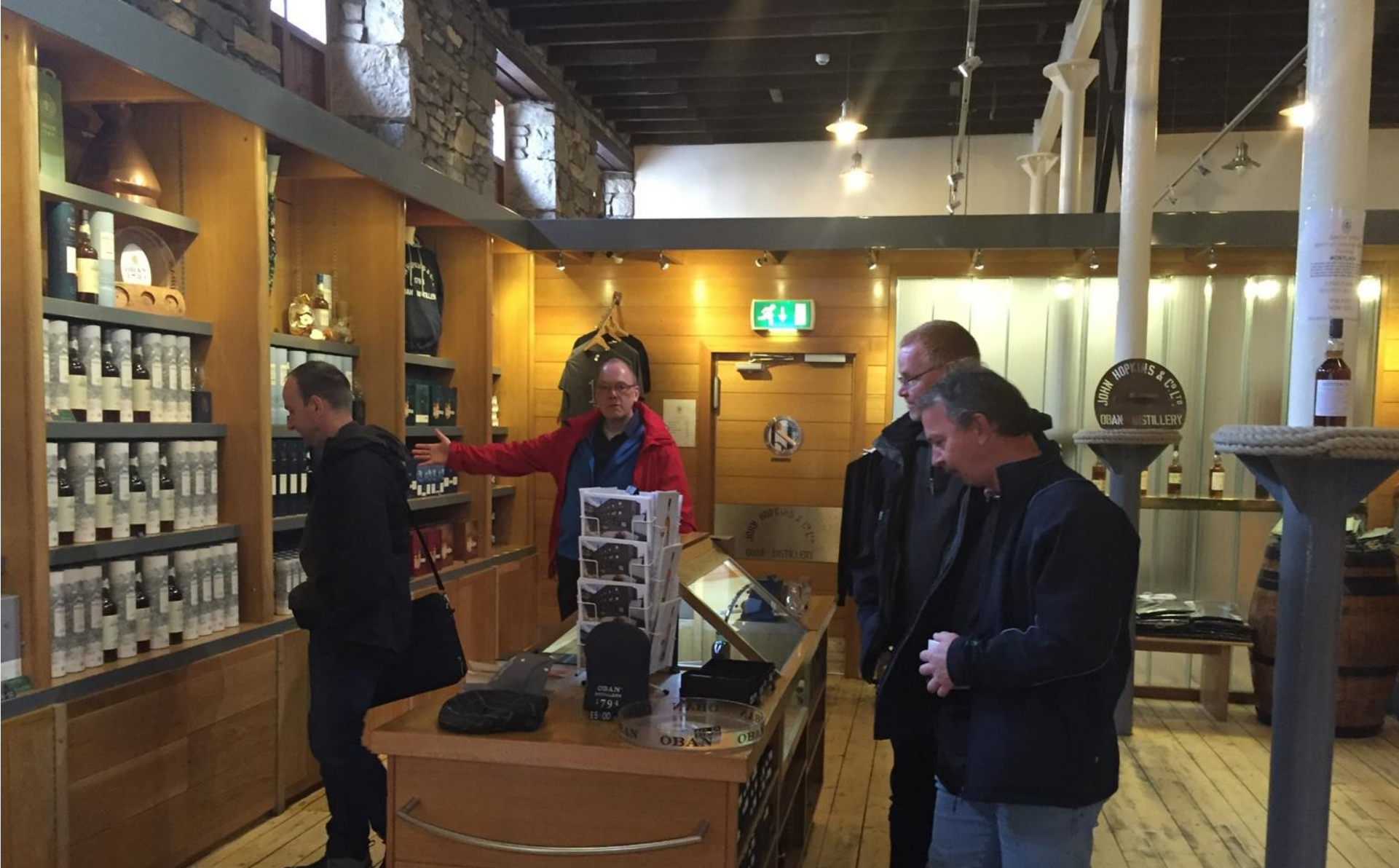
OBAN Destillery Alles was das Herz begehrt!